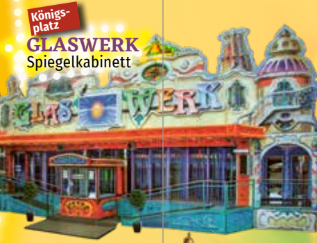
KINDER KARUSSELLS Königsplatz GLASWERK Spiegelkabinett