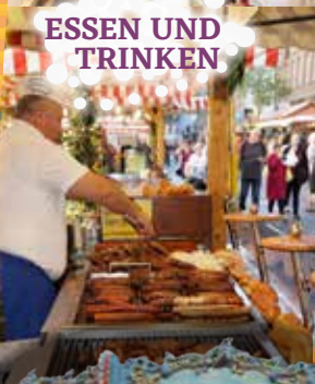
ESSEN UND TRINKEN