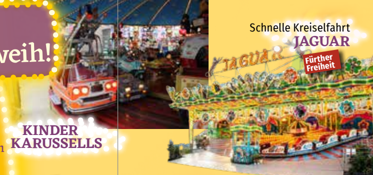
Schnelle Kreiselfahrt JAGUAR Fürther Freiheit

Öffnungszeiten der Kirchweih: NEU tägl. 11.00 - 23.00 Uhr Ausschank bis 22.45 Uhr