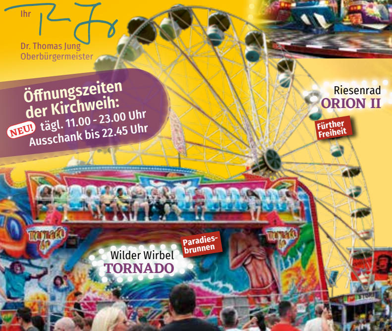
Riesenrad ORION II Fürther Freiheit

Königsstraße HELIKOPTER Fa. F. Hartig, Weisendorf Paradiesbrunnen JUMPER Fa. M. Schultz, Homburg