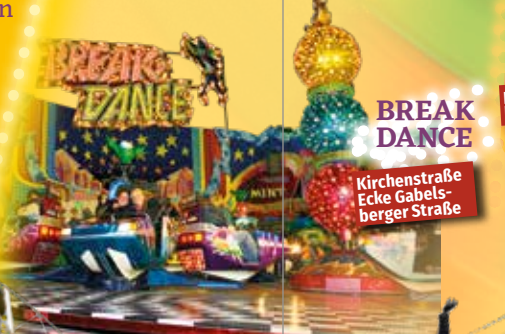
BREAK DANCE Kirchenstraße Ecke Gabelsberger Straße