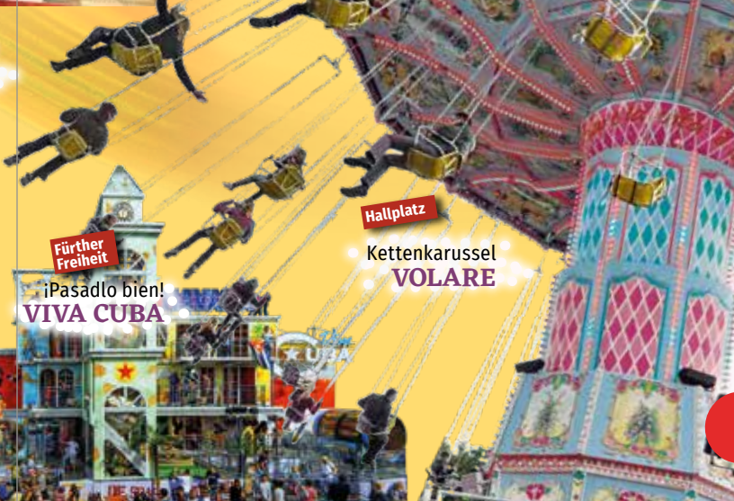
Kettenkarussell VOLARE Hallplatz